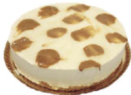
14 | Queso y dulce de leche RAC 135 gr | 1900 gr

Base de bizcocho blanco relleno de mousse de galleta y mousse de chocolate blanco con galletas troceadas terminado con glaseado de crema guianduia. 502