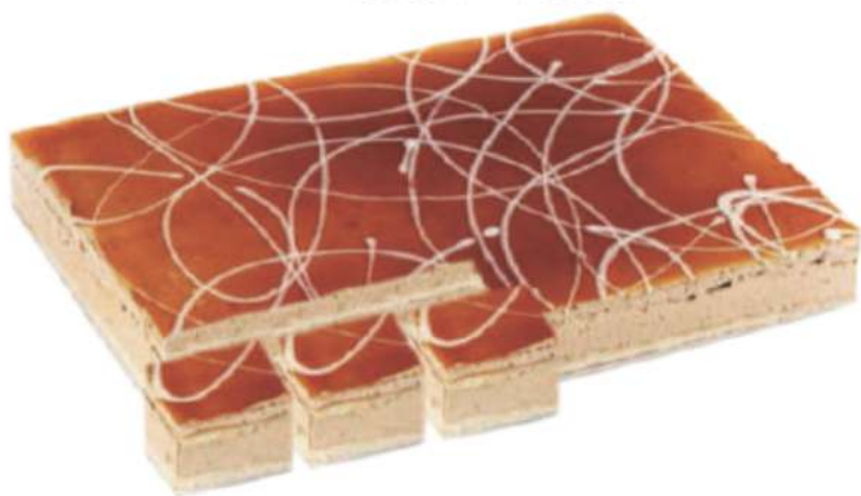
24 Pl. Dulce de Leche RAC 83 gr 2000 gr 302427