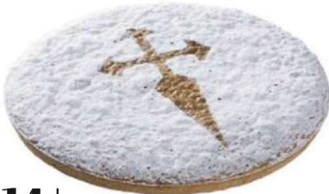
14 | Tarta de Santiago RAC | 1000 gr 71 gr Almendra, huevo y mantequilla. IDG (Indicación Demográfica Protegida) que garantiza la calidad e los ingredientes. 300002