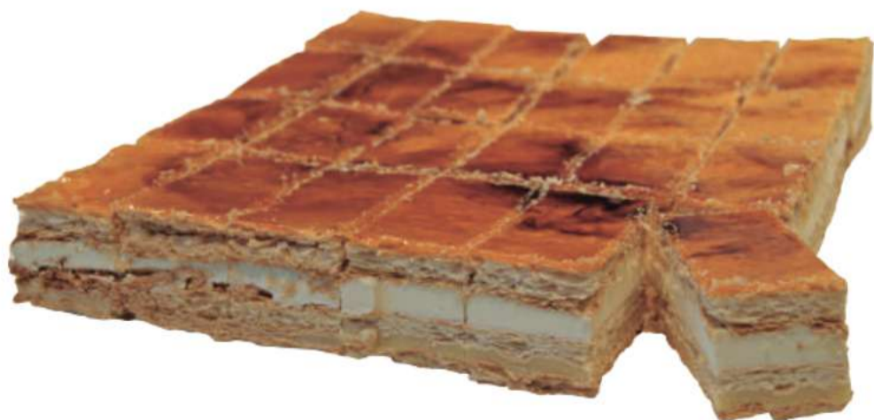
24 | Milhojas sabor yema RAC | 2650 gr 110 gr

Base de crema pastelera, galleta tostada y chocolate. 302740