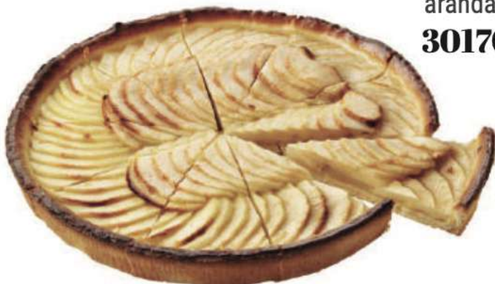
10 | Tarta manzana pastelera RAC | 3x750 gr 75 gr Pasta brisa, con rebanadas de manzana y compota de manzana. 1984