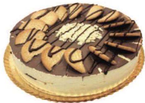
14 | Galleta guianduia RAC 135 gr | 1900 gr

Base de bizcocho brownie, rellena de mermelada de albaricoque y terminada con chocolate de avellana. 520