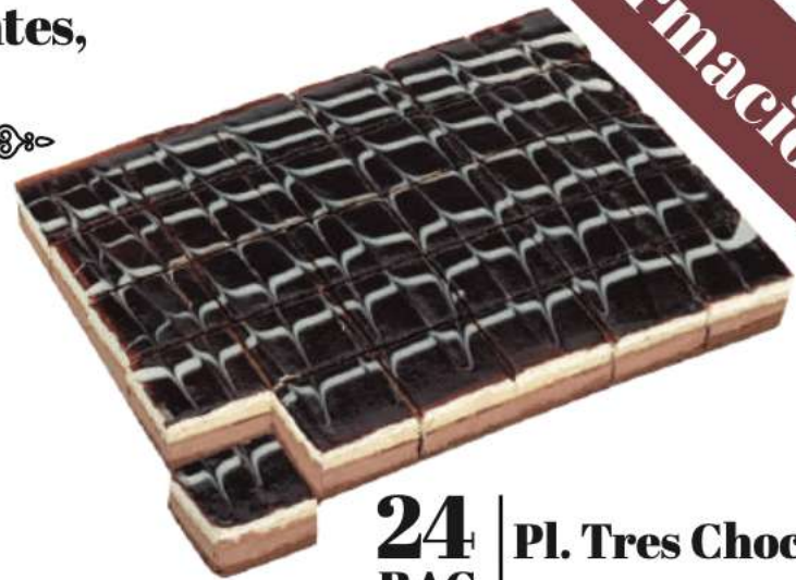
24 Pl. Tres Chocolates RAC 83 gr 2000 gr 302024