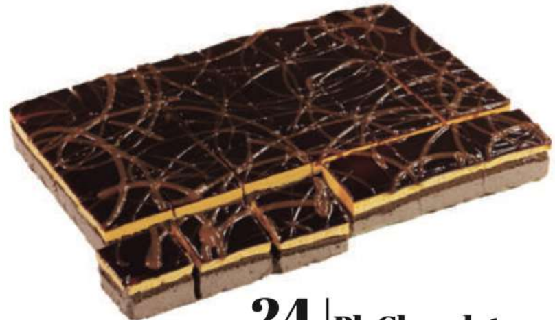
24 Pl. Chocolate con naranja RAC 83 gr 2000 gr 302443