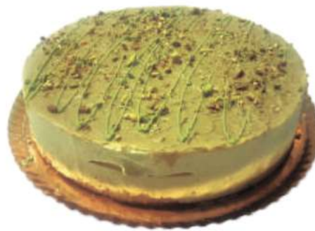
14 | Pistacho puro RAC 114 gr | 1600 gr

Base de bizcocho blanco con mousse de pistacho y núcleo de mousse de chocolate blanco terminado con pistachos tostados. 509