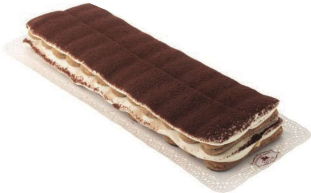
10 | Tiramisú Savoirdi RAC | 1000 gr 100 gr

Savoirdi bañados en café, cubierto de crema chantilly y mascarpone, espolvoreado con cacao. 8015