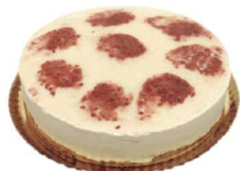
14 | Queso y frambuesa RAC 135 gr | 1900 gr

Queso philadelphia al horno sobre una mousse de queso marmoleada con dulce de leche. 501