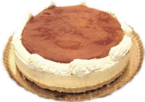
14 | Tocino de cielo y piñones RAC 135 gr | 1900 gr

Base de bizcocho blanco con mousse de pistacho y núcleo de mousse de chocolate blanco terminado con pistachos tostados. 509