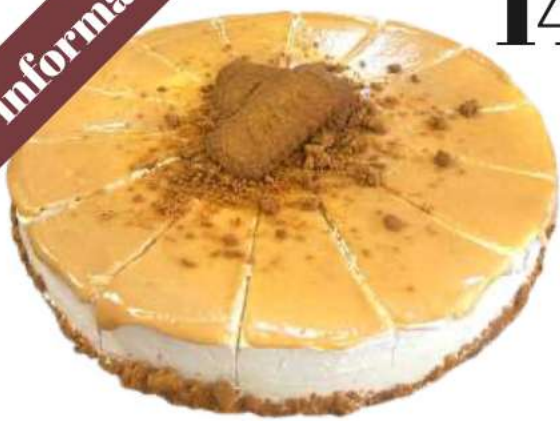
14 | Galleta Lottus con dulce de leche 1300 gr

Base de galleta con mantequilla bajo un relleno de cheesecake de queso crema, decorado con cobertura de dulce de leche. 700930