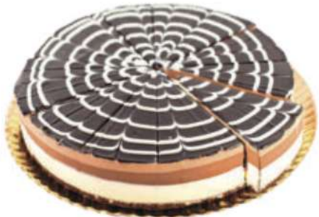
14 | Brownie 5 chocolates RAC 135 gr | 1900 gr

Base de brownie relleno de cobertura de chocolate, chocolate con leche, blanco y glaseado de chocolate. 503