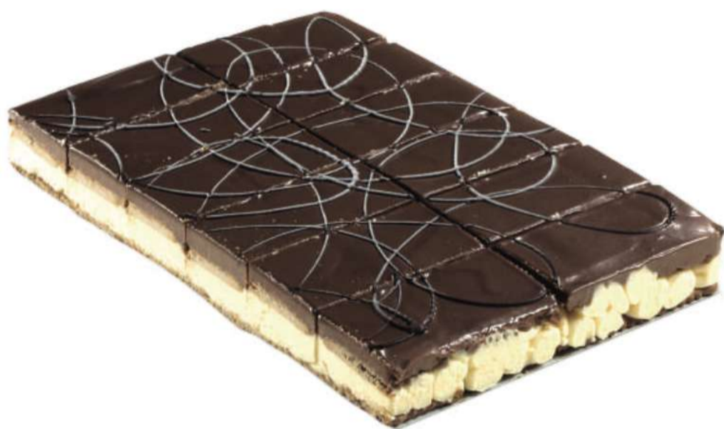
12 | Tarta de galleta de la abuela RAC | 1400 gr 115 gr

Savoirdi bañados en café, cubierto de crema chantilly y mascarpone, espolvoreado con cacao. 8015