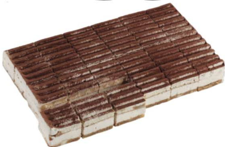
24 Pl. Tiramisú RAC 75 gr 1800 gr 302409