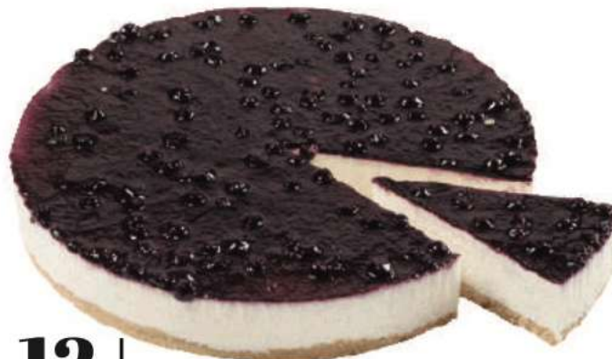
12 | Queso con arándanos RAC | 1200 gr 100 gr Queso fresco sobre una crujiente base de galleta recubierta con mermelada de arándanos. 301705