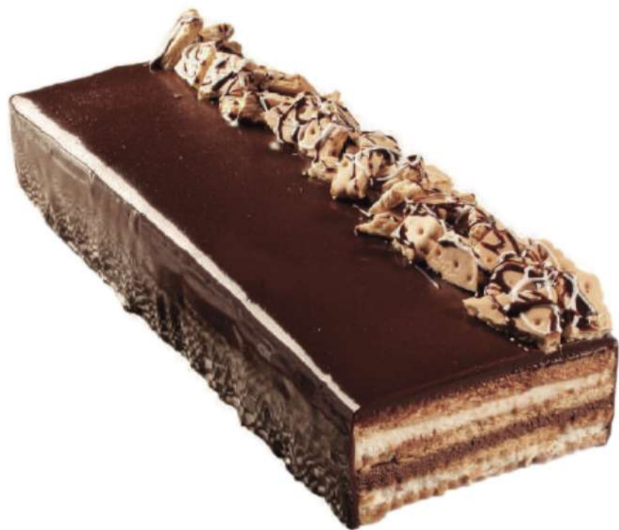
11 | Tarta de la Abuela RAC | 1100 gr 100 gr | 58837