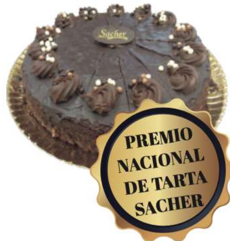
14 | Sacher austriaca RAC 135 gr | 1900 gr

Base de galleta con crema de queso y tocino de cielo relleno de piñones terminada con lámina de tocino de cielo. 507