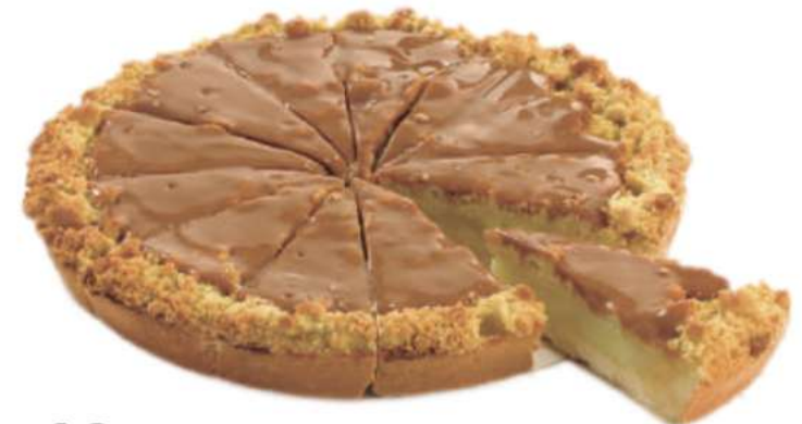
12 | Manzana y caramelo RAC | 4 x 1800 gr 150 gr 58853