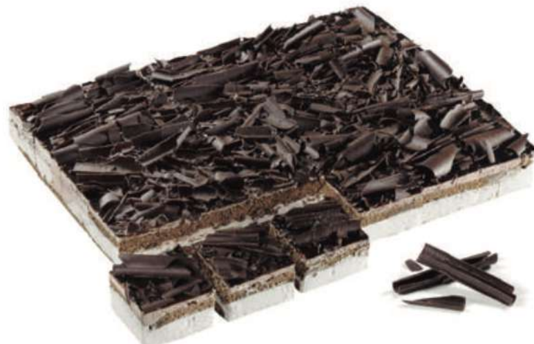
24 Pl. Selva Negra RAC 83 gr 2000 gr 302445