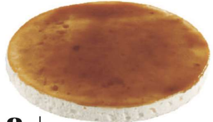
8 | Tarta de orujo RAC | 800 gr 100 gr Base de bizcocho con nata y orujo. 301502