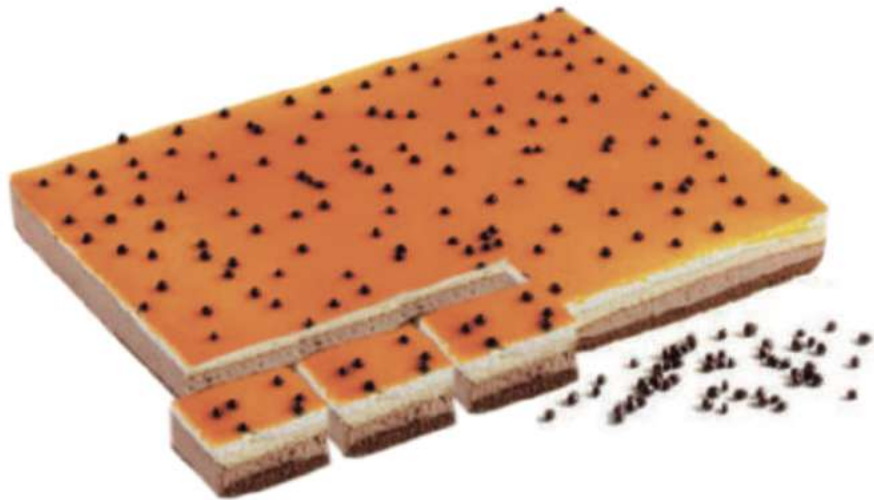
24 Pl. San Marcos RAC 83 gr 2000 gr 302407