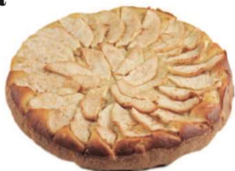
14 | Manzana RAC 135 gr | 1900 gr

Queso philadelphia al horno sobre una mousse de queso marmoleada con frambuesa. 500