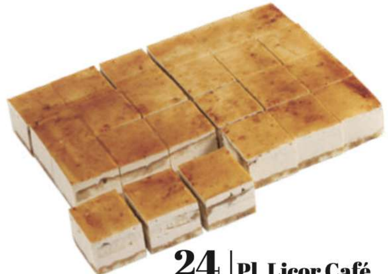
24 Pl. Licor Café RAC 83 gr 2000 gr 302425