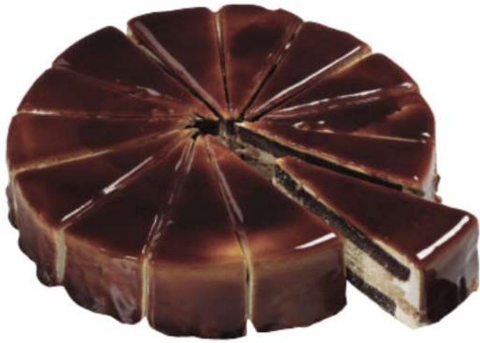
14 | Tarta galleta y caramelo RAC | 1500 gr 107 gr Relleno de galleta entre dos capas de bizcocho de chocolate, decorado con cobertura de caramelo. 301032