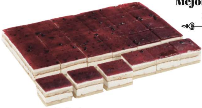
24 Pl. Queso - Arándanos RAC 83 gr 2000 gr 302410