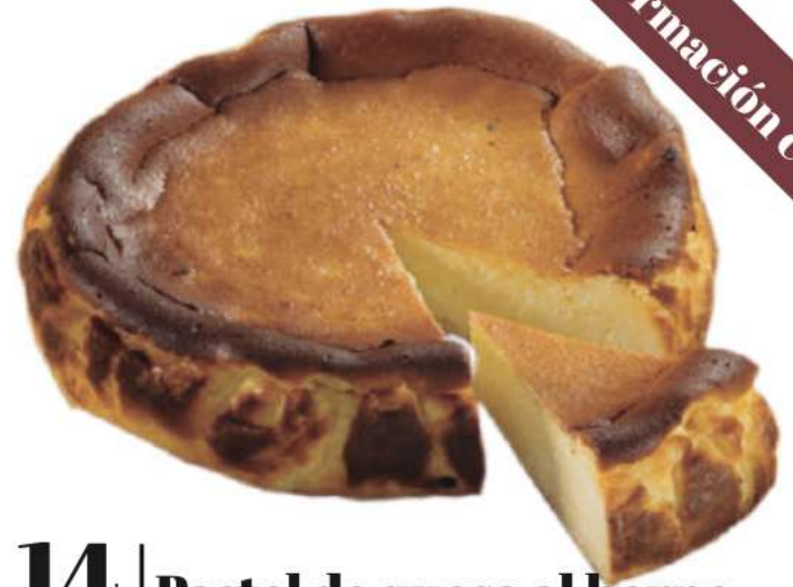
14 | Pastel de queso al horno RAC | 1800 gr 128 gr Queso fresco, nata y azúcar. 300023