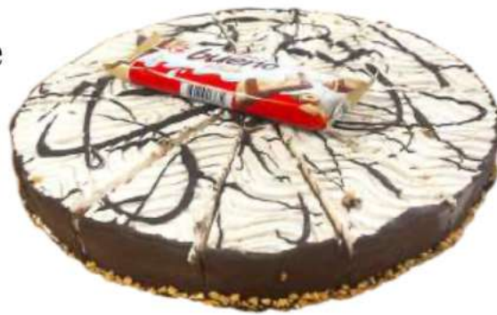
14 | Choco Kinder 1900 gr

Base de galleta cubierta por galletas empaadas en café que se intercalan con chocolate blanco con sabor a vellana, crema y chocolate. Decorada con cacahuete crujiente y trocitos de chocolate Kinder. 700805